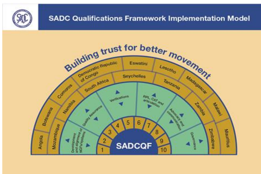
Figura 5 : Infográfico do Modelo de Implementação de Qualificações do SADCQF