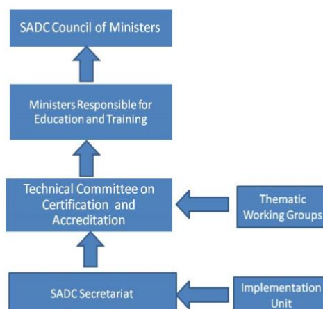
Figura 3: Quadro de Governação do SADCQF

O Conselho de Ministros da SADC, os Ministros responsáveis pela Educação e Formação, o Comité Técnico de Certificação e Acreditação (TCCA), o Comité Executivo do TCCA (TCCA EXCO) e uma Unidade de Implementação (UI) são as principais estruturas de governação para a implementação do SADCQF, tal como se pode ver na figura abaixo.