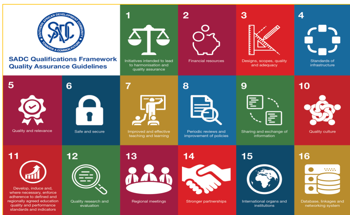
Figura 4: Infográfico das diretrizes de garantia de qualidade do SADCQF

A região da SADC está ciente da importância de sistemas eficazes e robustos relativos aos mecanismos de garantia de qualidade na prestação de educação e formação para assegurar a confiança e credibilidade das qualificações. O SADCQF é apoiado por diretrizes regionais de garantia de qualidade, que estabelecem princípios e normas para sistemas e mecanismos de garantia de qualidade tanto internos como externos. A figura abaixo representa um infográfico sobre as dezesseis diretrizes de garantia de qualidade.