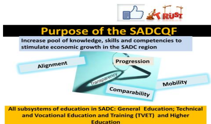
Figura 1: Objetivo e Âmbito do SADCQF